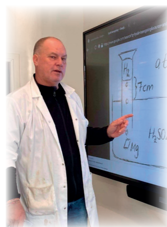
Kim underviser i fysik