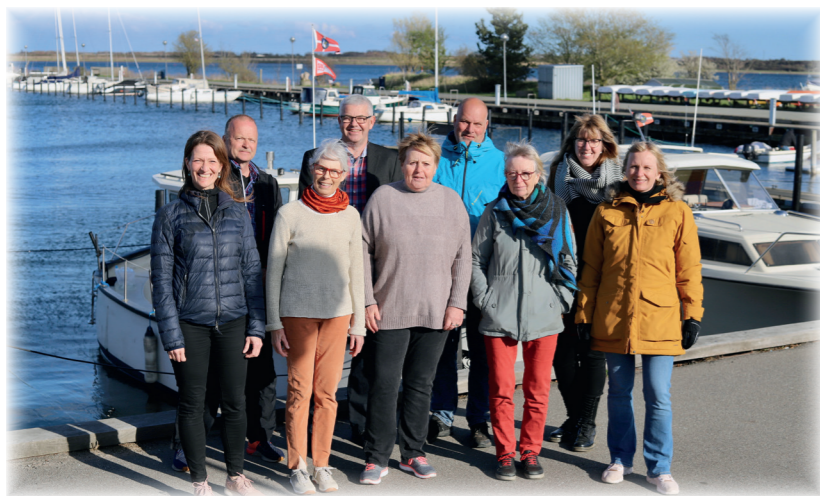
Hvidovrelistens bestyrelse i Hvidovre Havn

Har du lyst til at blive medlem af foreningen, er du hjertelig velkommen!