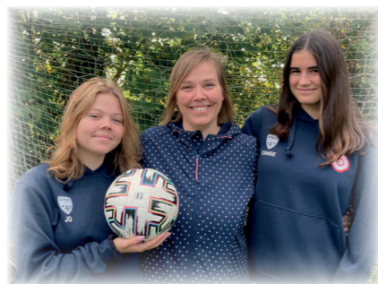
Trine med fodboldpiger